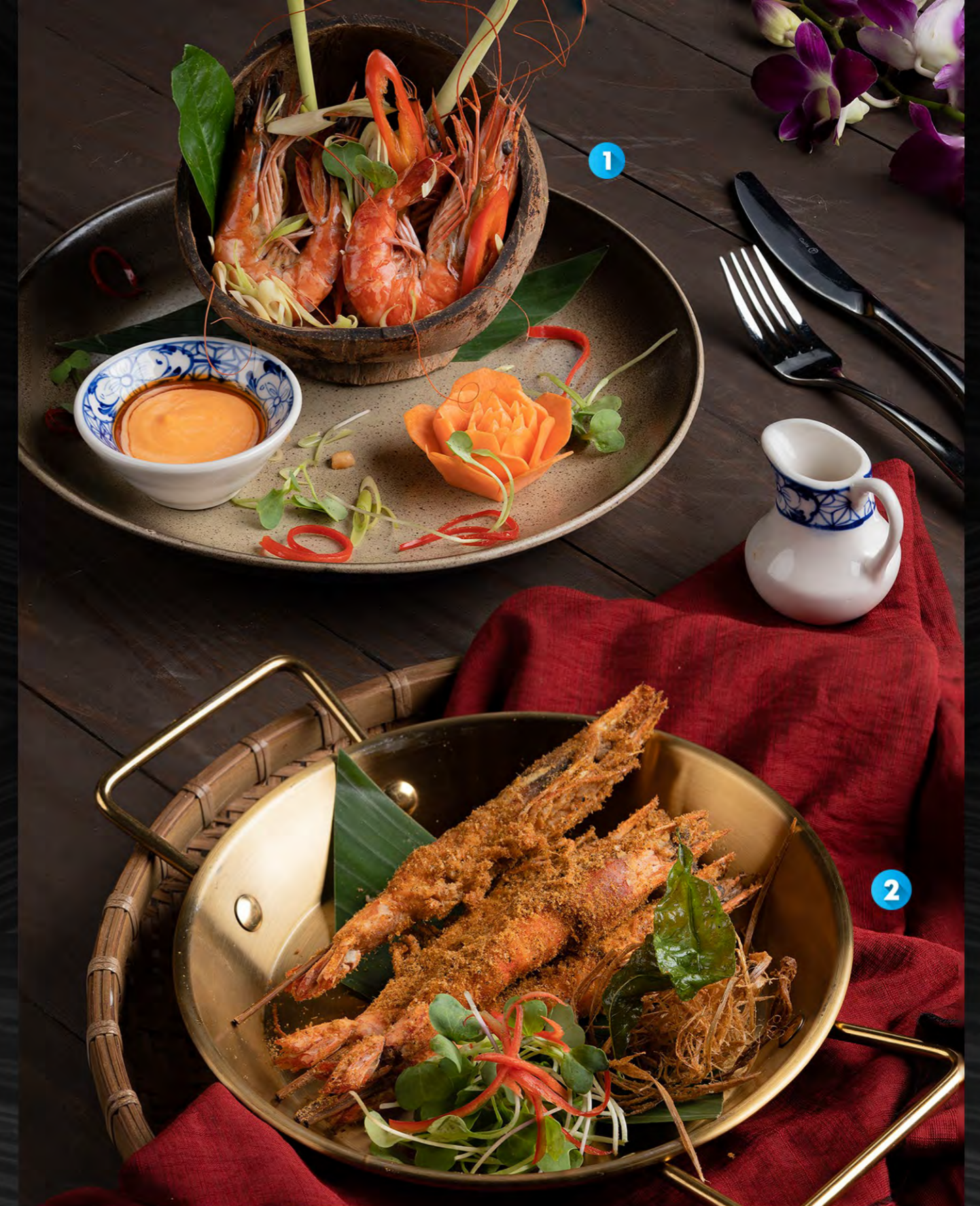
1 STEAMED PRAWNS 코코넛 새우 찜 코코넛으로 찜 새우